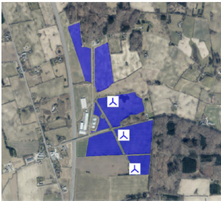
Opstillers illustration af hybridprojekt ved Højde Dong.

Opstiller ønsker at etablere et hybridprojekt bestående af ca. 50 hektar solenergi og tre vindmøller á 150 meter, beliggende øst for Svendborgmotorvejen.